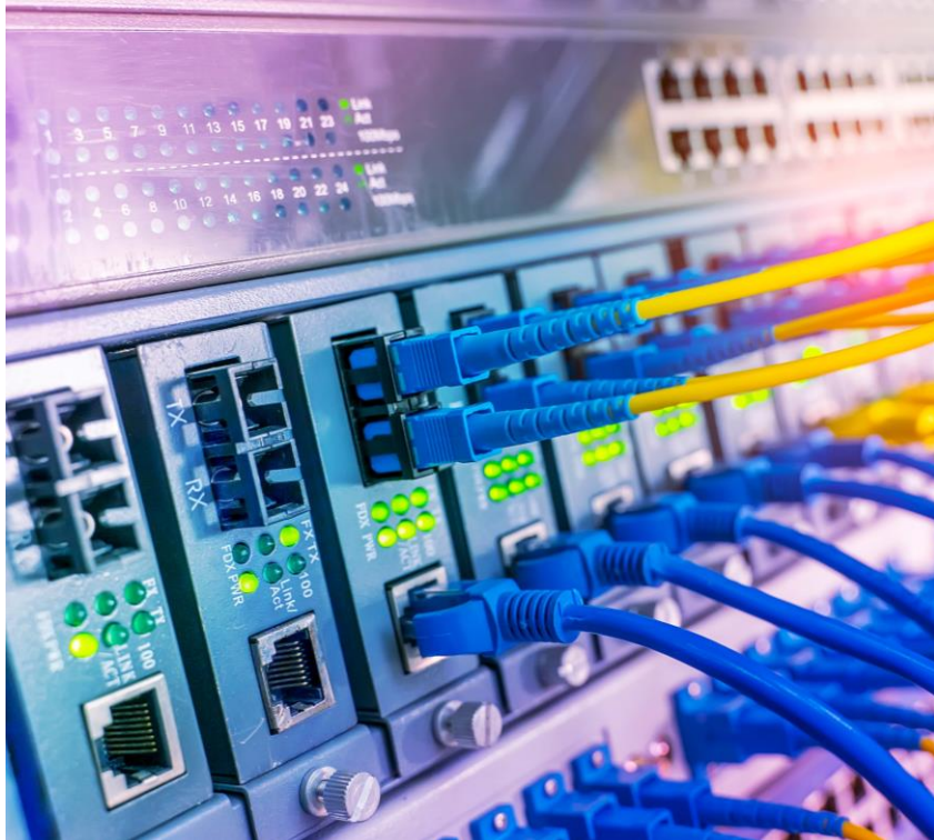
Serveurs Virtual Machine (VM)